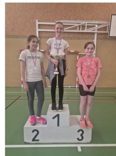
CM2 - Filles