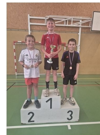
CM2 - Garçons