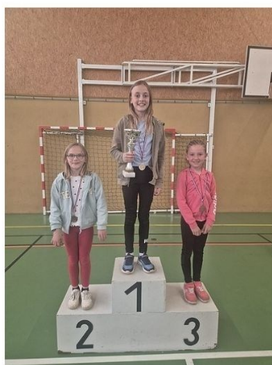
CM1 - Filles