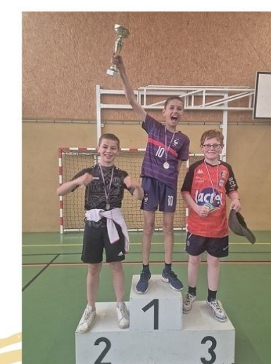
5e - Garçons