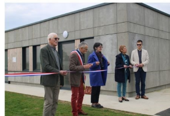
Inauguration du stade

N'hésitez pas à me contacter si vous avez des souvenirs à partager ou si vous reconnaissez quelqu'un ! Rémy Lechevrel