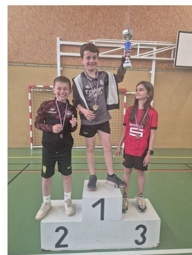
CM1 - garçons