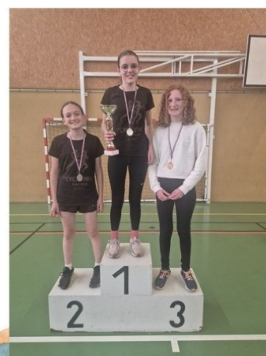
5e - Filles