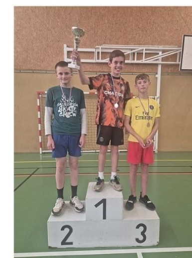
6e - Garçons