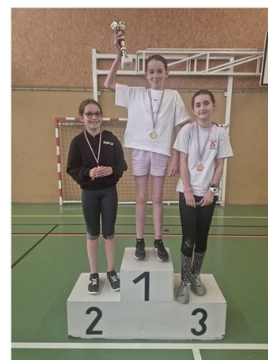
6e - Filles