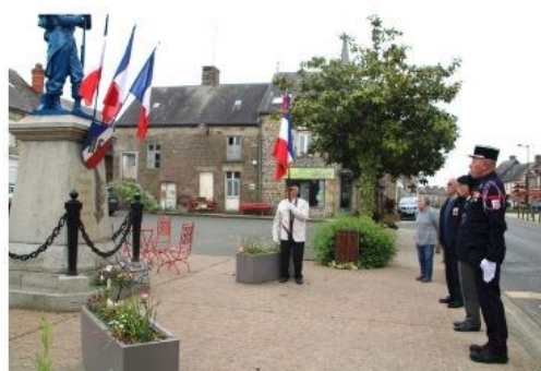
fête nationale de Jeanne d'Arc

Sept-Forges et les bénévoles ainsi que la commune et Yannick Pousset pour le prêt du matériel.