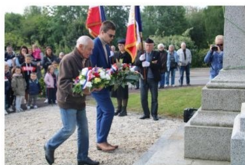
anniversaire de l'armistice du 8 mai 1945

Pour la France, aux jours de liesse populaire de la Libération succèdent des lendemains désenchantés. Le pays sort meurtri et exsangue des années de guerre et d'occupation : des pertes humaines élevées, des villes détruites, une économie dévastée et le rationnement qui demeure. Le temps de la reconstruction peut commencer.