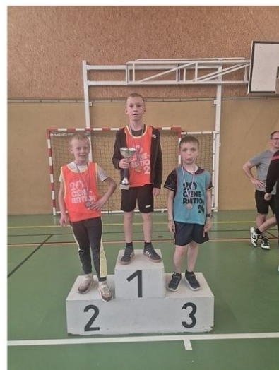
CE2 - Garçons