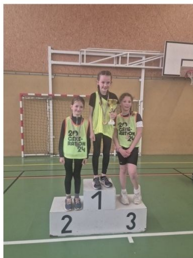
CE2 - Filles